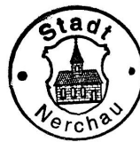
Uwe Cieslack Bürgermeister